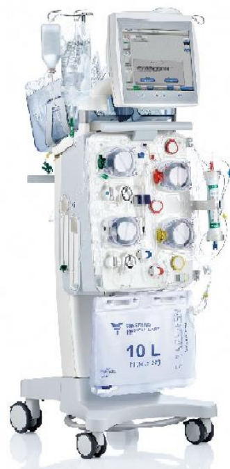
De CVVHD machine

Het bloed wordt vanuit de patiënt via de dialysekatheeter naar de CVVHD machine gepompt. Hier wordt het bloed in de kunstnier gezuiverd en stroomt het weer terug naar de patiënt.