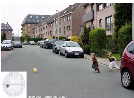
Glaucoom: geen schade

Op deze foto's is te zien wat iemand met glaucoom wel en niet kan zien. De hersenen proberen het ontbrekende gedeelte in te vullen zodat het lijkt alsof het beeld redelijk klopt. In werkelijkheid ontbreekt een deel van het beeld. In de linker onder hoek is het bijbehorende gezichtsveldonderzoek te zien.