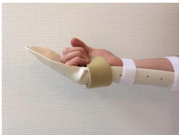
Actieve volle vuist