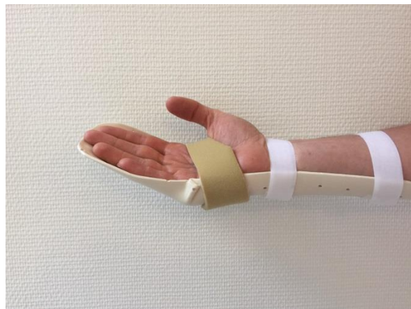
Actief strekken tegen de kap