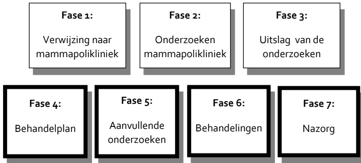
Afbeelding: Zorgpad borstkanker