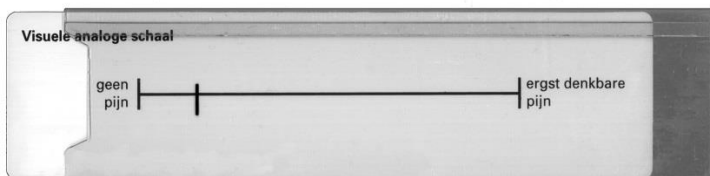
Afbeelding 1: Pijnmeetlat, voorkant

Er bestaat niet een objectief meetinstrument voor pijn, zoals een thermometer voor temperatuur. Daarom is de Visuele Analoge Schaal (VAS) ontwikkeld. Dit is een meetlat waarop u kunt aangeven hoe u de pijn op dat moment ervaart (zie afbeelding 1).