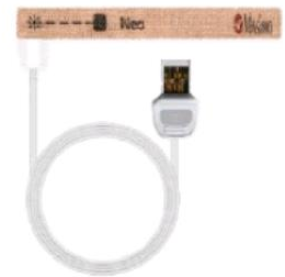
Rad-G Disposable Sensor Gewicht: 3kg – 20kg <3kg – > 40kg