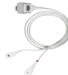
Rad-G YI Sensor Gewicht ≥ 1kg