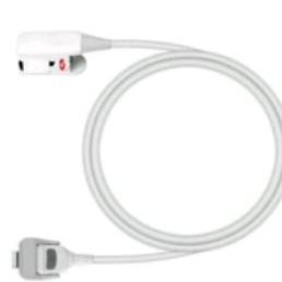
Rad-G Reusable Sensor Gewicht ≥ 3kg